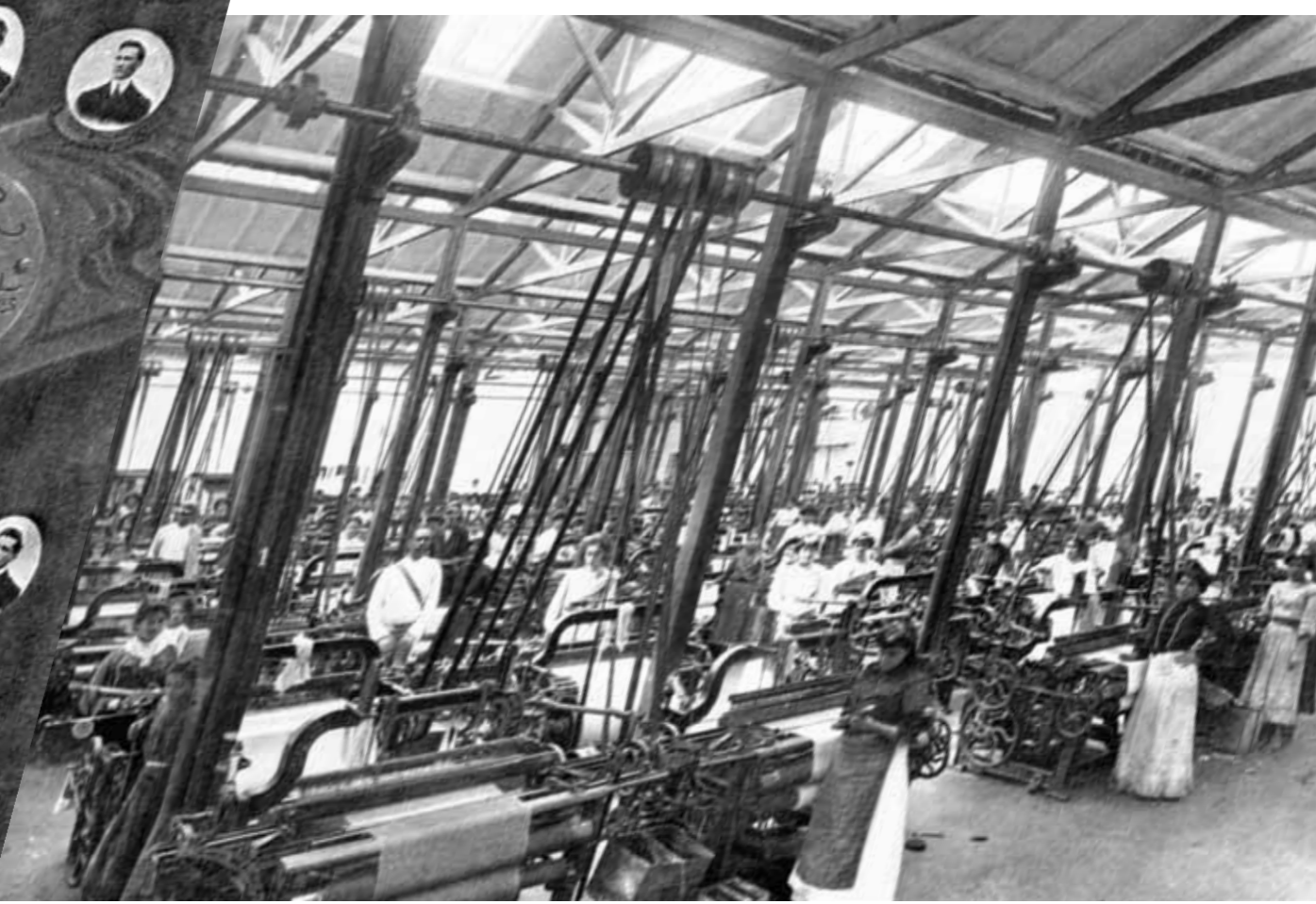
Fábrica de Tejidos de Bello

Cuadro alegórico del Primer congreso internacional de estudiantes de la Gran Colombia. [En Primer Centenario de la Independencia, Escuela tipográfica salesiana] · Domingo Moreno Otero - Aristides Ariza · 1911 · Impreso · Museo Nacional de Colombia