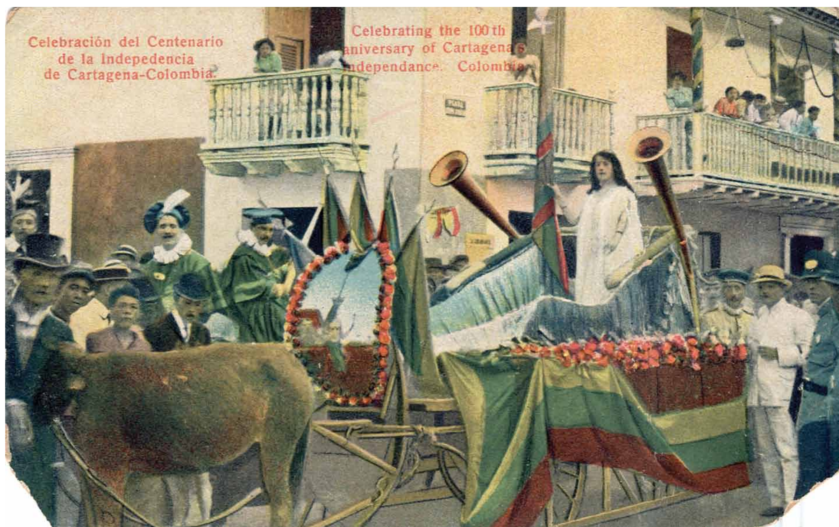
Carro alegórico de la Independencia de Cartagena el 11 de noviembre de 1911. Como reacción a la propuesta centralista, las ciudades donde también se formaron juntas en 1810 afirmaron el carácter nacional de sus respectivas celebraciones.

Comparsa en la conmemoración del Centenario de la Independencia de Cartagena · Noviembre 11 de 1911 · Copia en gelatina