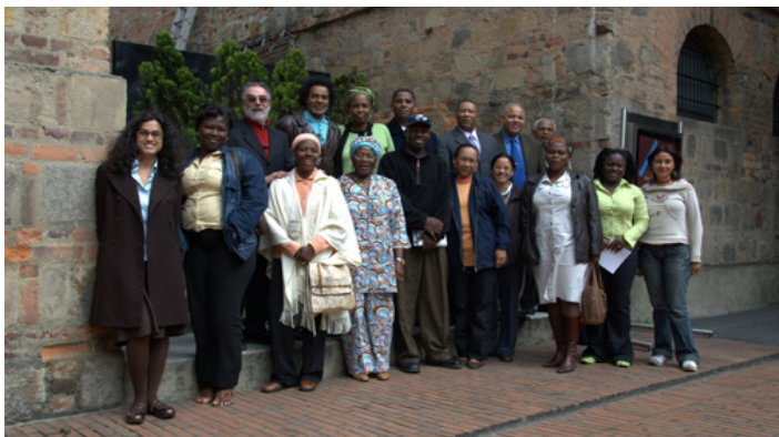
Imagen 6 Encuentro de sabedores y sabedoras con el equipo de la Curaduría de Arte e Historia y los antropólogos el 13 de septiembre de 2007

En lo que concierne al Museo, como institución debe responder frente a 185 años de historia que aún reflejan en sus colecciones la representación de la homogeneización oficial, que ha sido excluyente e irrespetuosa –y, por lo tanto, contribuye consciente o inconscientemente a las formas generalizadas de discriminación y racismo. Sí, existe una necesidad de transformación, pero sólo se puede hacer con la colaboración y la contribución de los estudiosos y de las comunidades, a través de un proceso continuo de proyectos como el actual.