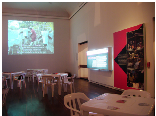
Imagen 7 Primer espacio de la exposición. Al fondo el vídeo sobre los contextos políticos, económicos y culturales que amenazan las comunidades afrodescendientes

Así que, ¿cómo van a exponer los museos los conflictos entre los diferentes grupos? En esta exposición, las manifestaciones espirituales y simbólicas estuvieron precedidas por imágenes de los contextos de cambios políticos, sociales y económicos. Además, los altares fueron consagrados a aquellos que no recibieron los ritos funerarios, debido al conflicto armado colombiano. ¿Cómo interpretarán los visitantes esta información? ¿La cultura puede ser política al interior del museo? ¿Podemos llamar los crímenes por sus nombres? La cuestión de