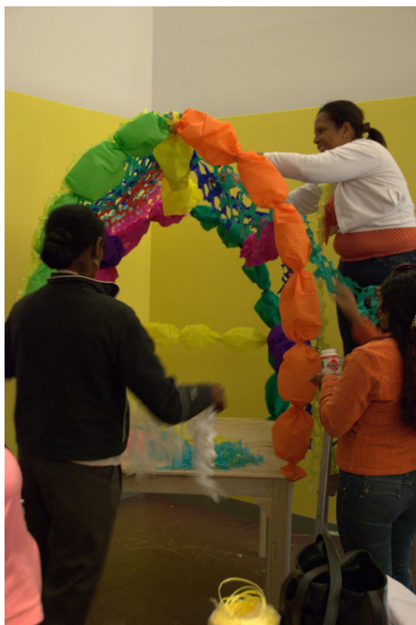
Imagen 3 Miembros de la comunidad de San José de Uré, Córdoba, arman el altar para ceremonia de niño en la Sala de Exposiciones Temporales