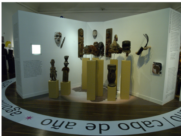
Imagen 1 Culto a los antepasados. Piezas del África Central pertenecientes a las colecciones del Museo Nacional de Colombia, que se exhibieron en la exposición Velorios y santos vivos

A partir de estas posiciones, situar el “yo” se convierte en pieza clave del proyecto de investigación y exposición colectiva que pretende transmutar la capacidad del Museo Nacional de Colombia de incorporar derechos, necesidades e inquietudes de las comunidades afrodescendientes 3 colombianas, de forma que se representen y se reconozcan sus contribuciones a la Nación, en diversos ámbitos.