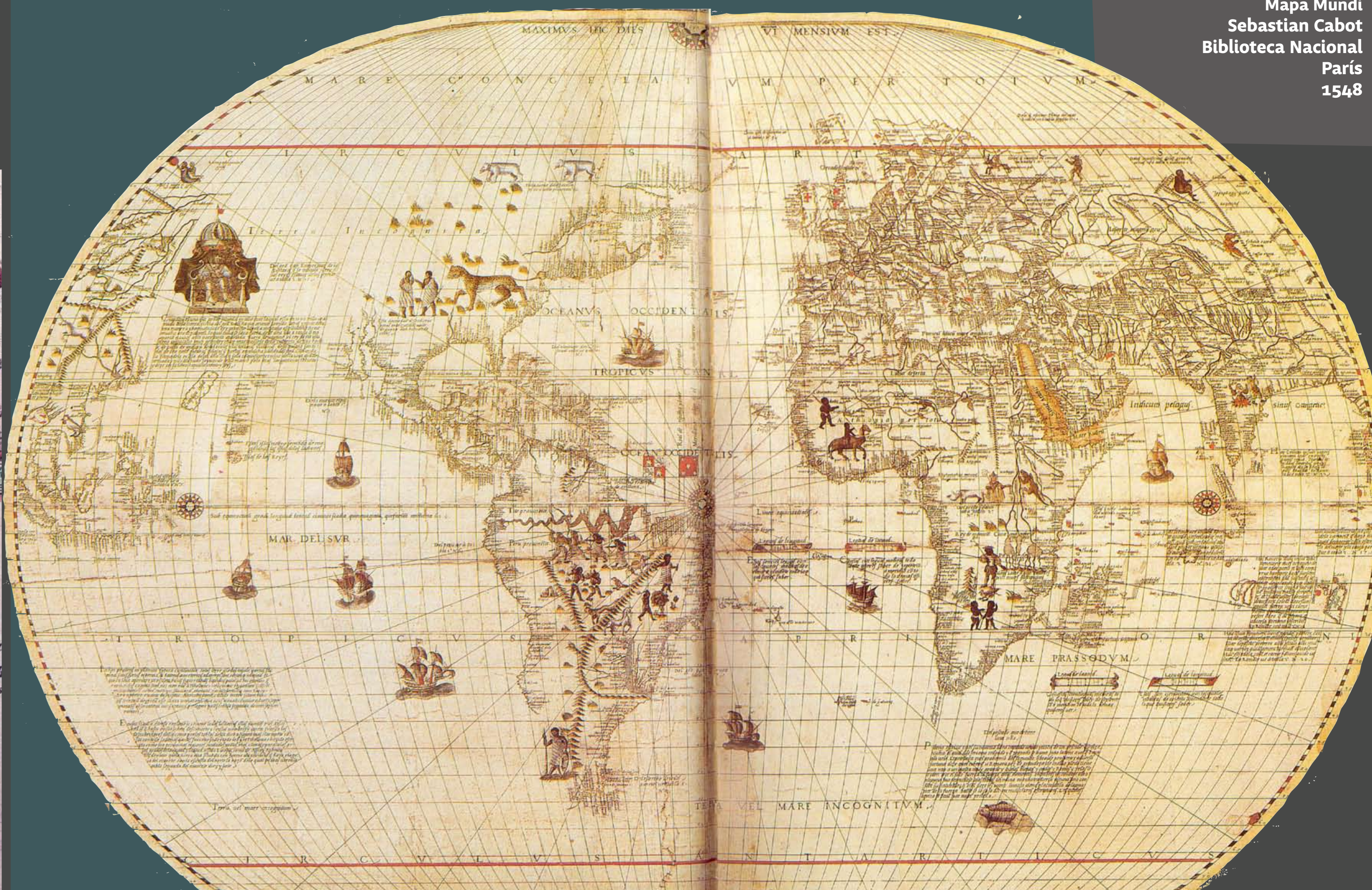
Mapa Mundi Sebastian Cabot Biblioteca Nacional París 1548