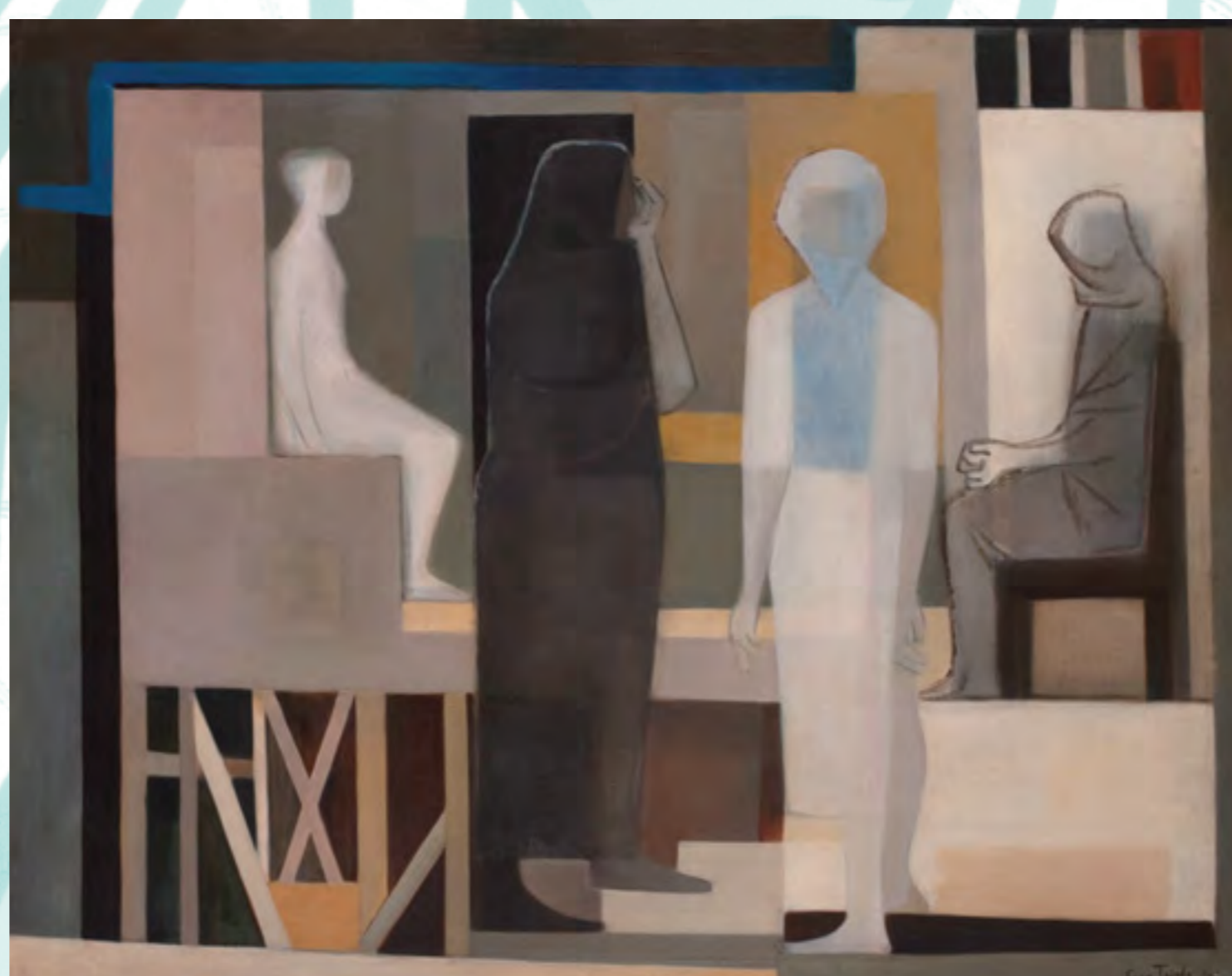
ESCENA GEORGIANA A LAS VIUDAS Lucy Tejada Sáenz 1961 Óleo sobre tela 88,5 x 109 cm Colección Museo Nacional de Colombia

En Escena georgiana a las viudas , la artista Lucy Tejada (1920–2011) recrea un escenario donde las actrices y las espectadoras simplemente esperan, como en una pieza de teatro donde el tiempo no transcurre. Tejada pintó esta obra al inicio del Frente Nacional (1958–1974), cuando los artistas, los intelectuales y la sociedad civil realizaron un juicio de responsabilidades a los partidos tradicionales y a los políticos por las atrocidades del periodo de la violencia liberal-conservadora de mediados del siglo XX.