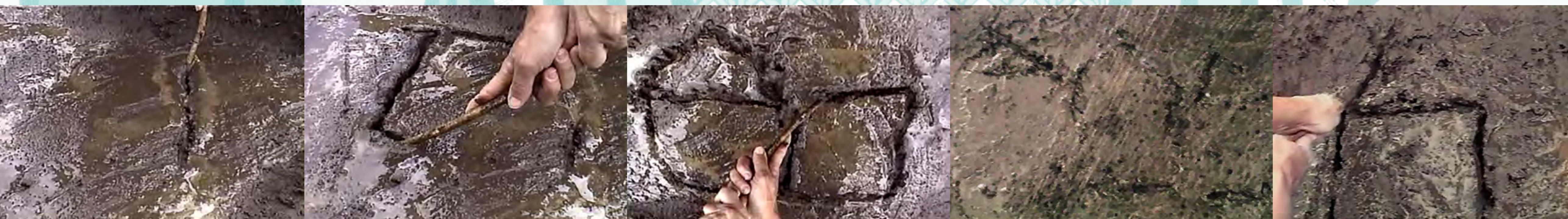
DE DOBLE FILO Clemencia Echeverri 1997–1998 Video original de 8'

En el video De doble filo de Clemencia Echeverri, la mano de una mujer dibuja con dificultad una casa sobre tierra movediza. La fuerza del agua borra el