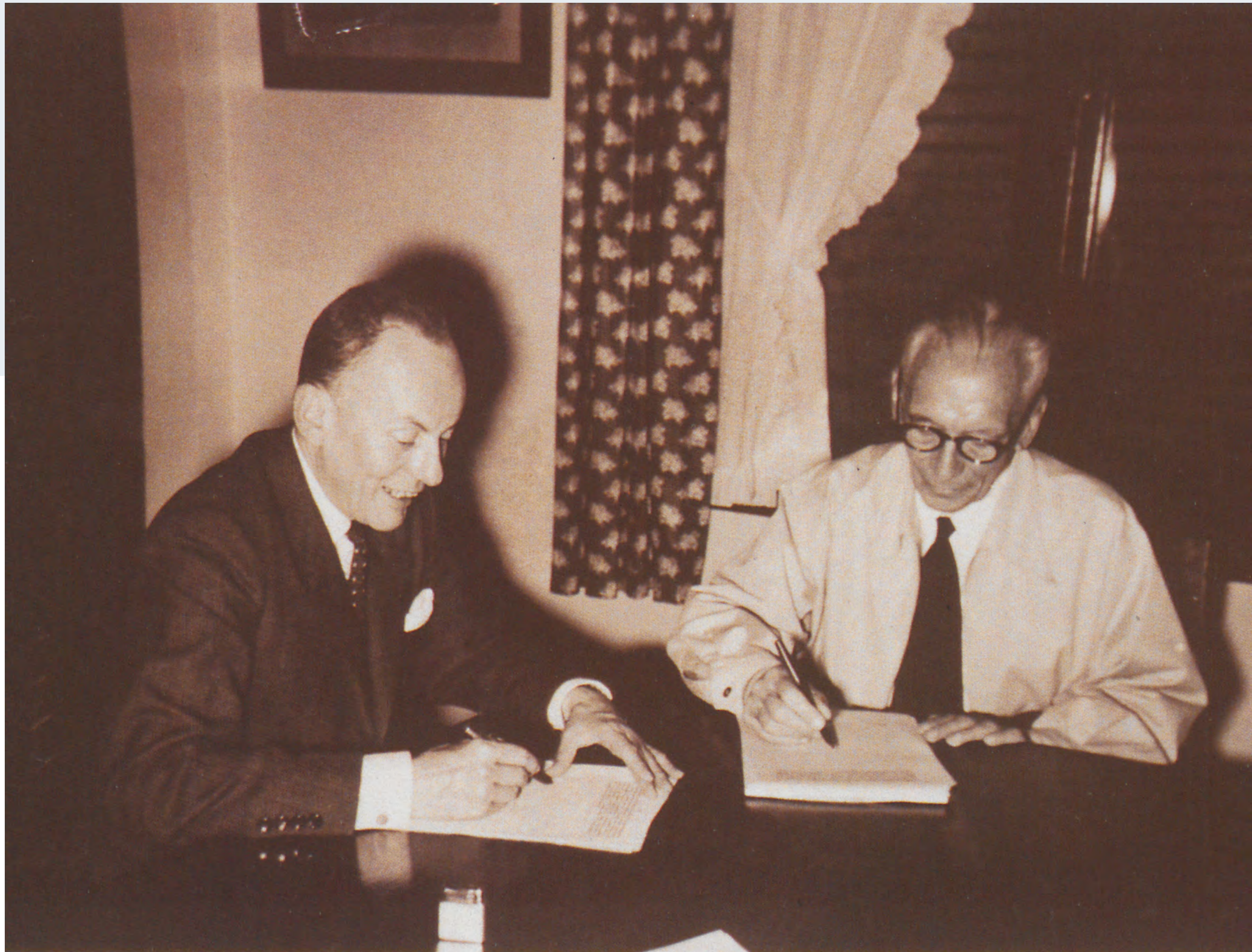
Autor desconocido Firma del Pacto de Benidorm 24.7.1956 Copia en goliatina Colección Museo Nacional de Colombia, reg. 3799