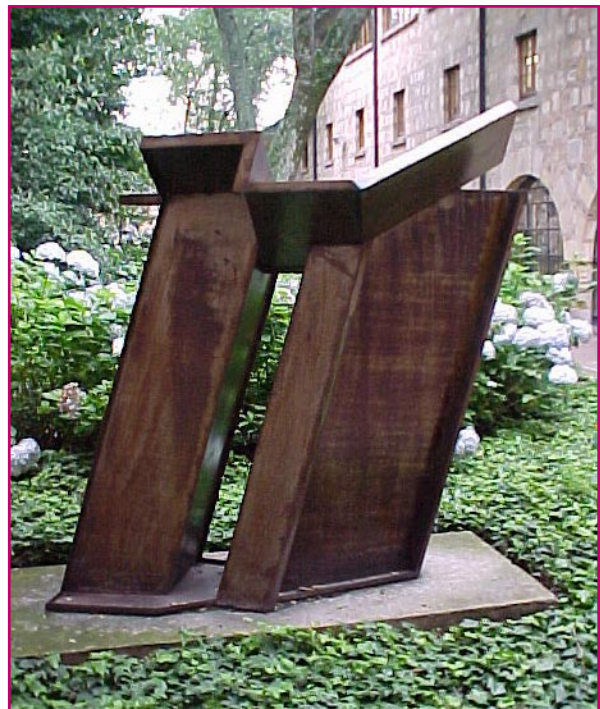
5. Eduardo Ramírez Villamizar Puerta del sol (Ensamble Hierro)

Colado: obtenido por fusión. Fundición. Forjado: hierro dulce trabajado dándole forma con el martillo.