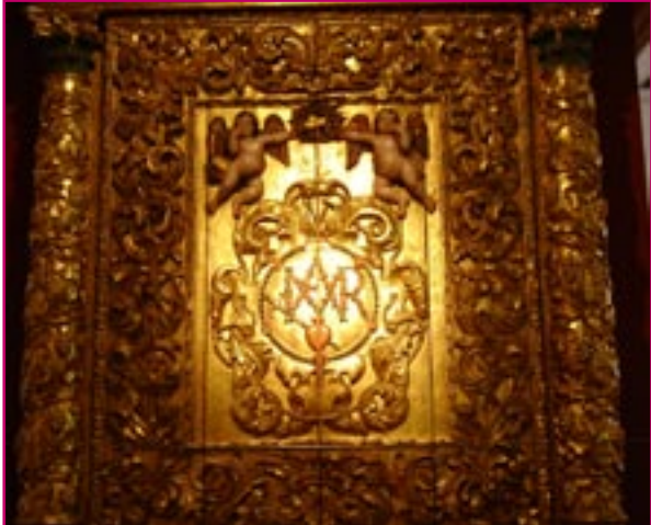
4. Puerta del camarín (esgrafiado, estofado, pan de oro, labrar, pasta)

Cincelado: técnica de orfebrería para realizar aristas o planos con golpes suaves de martillo sobre cincel.