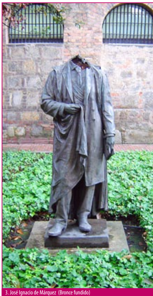
3. José Ignacio de Márquez (Bronce fundido)

Cera: Es una sustancia cuyo uso milenario ha sido aprovechado en el modelado de efigies y en el proceso de vaciado de metales, siendo el más conocido el denominado " a cera perdida ". La cera de abeja ha ido cediendo su lugar a las microcristalinas, subproducto de la industria del petróleo (2).