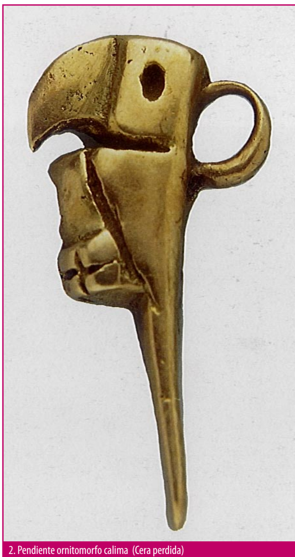
2. Pendiente ornitomorfo calima (Cera perdida)

Cemento: Sustancia en polvo compuesta de silicato de aluminio y calcio, que mezclada con agua forma una argamasa que seca muy rápidamente (2).