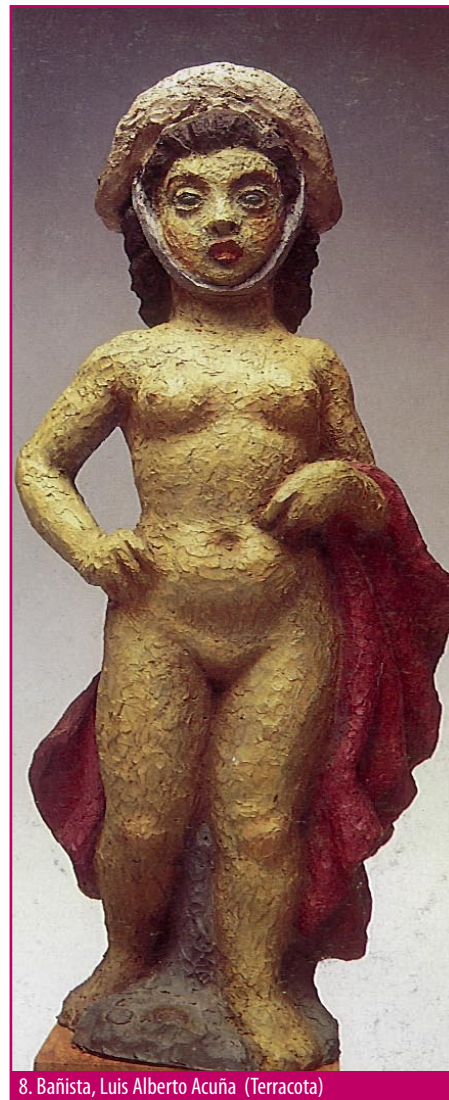
8. Bañista, Luis Alberto Acuña (Terracota)

Tornear: dar forma a un objeto con el torno.