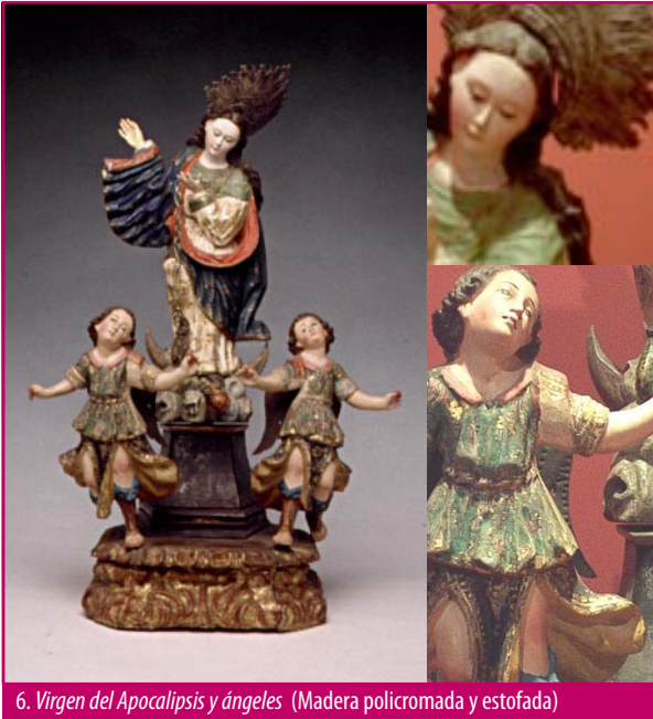
6. Virgen del Apocalipsis y ángeles. (Madera policromada y estofada)

Imagen de media talla o relieve: Técnica escultórica colonial heredada de la tradición hispana. Está constituida por una imagen hecha por separado del plano al que luego se encoda (Carlos Duarte. Historia de la escultura en Venezuela, p.22) (2).