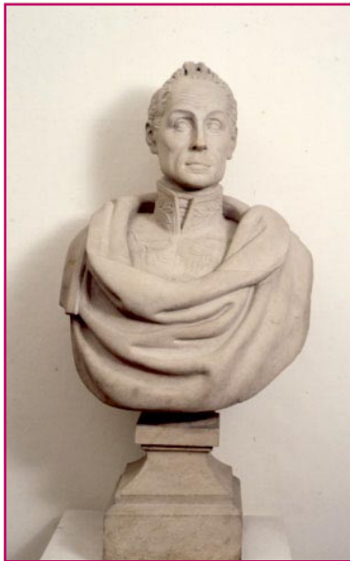
7. Francisco Camacho Busto de Bolívar (Piedra)

Pasta: masa moldeable, hecha con una materia cualquiera, particularmente oro o plata, fundido y sin labrar.