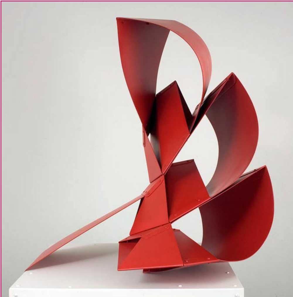
1. Edgar Negret Navegante (Ensamble - Aluminio)

Aluminio: Metal parecido a la plata, es ligero y resistente; sin embargo, se oxida al aire libre. Pulimentado adquiere una superficie brillante que debe barnizarse para lograr conservarla (2).