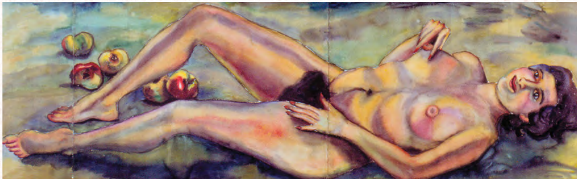
Débora Arango Ca. 1930-1940 Acuarela sobre papel 57 x 182 cm

En 1939, Débora Arango (1907-2005) presentó dos desnudos en el Club Unión de Medellín, que causaron controversia. Sobre el escándalo, comentó Arango: "El señor Arzobispo me llamó a interrogarme y a recriminarme. Yo le pregunté si había llamado a Pedro Nel Gómez, quien también estaba exponiendo desnudos en el mismo evento. Su respuesta fue: 'Es que él es hombre'."