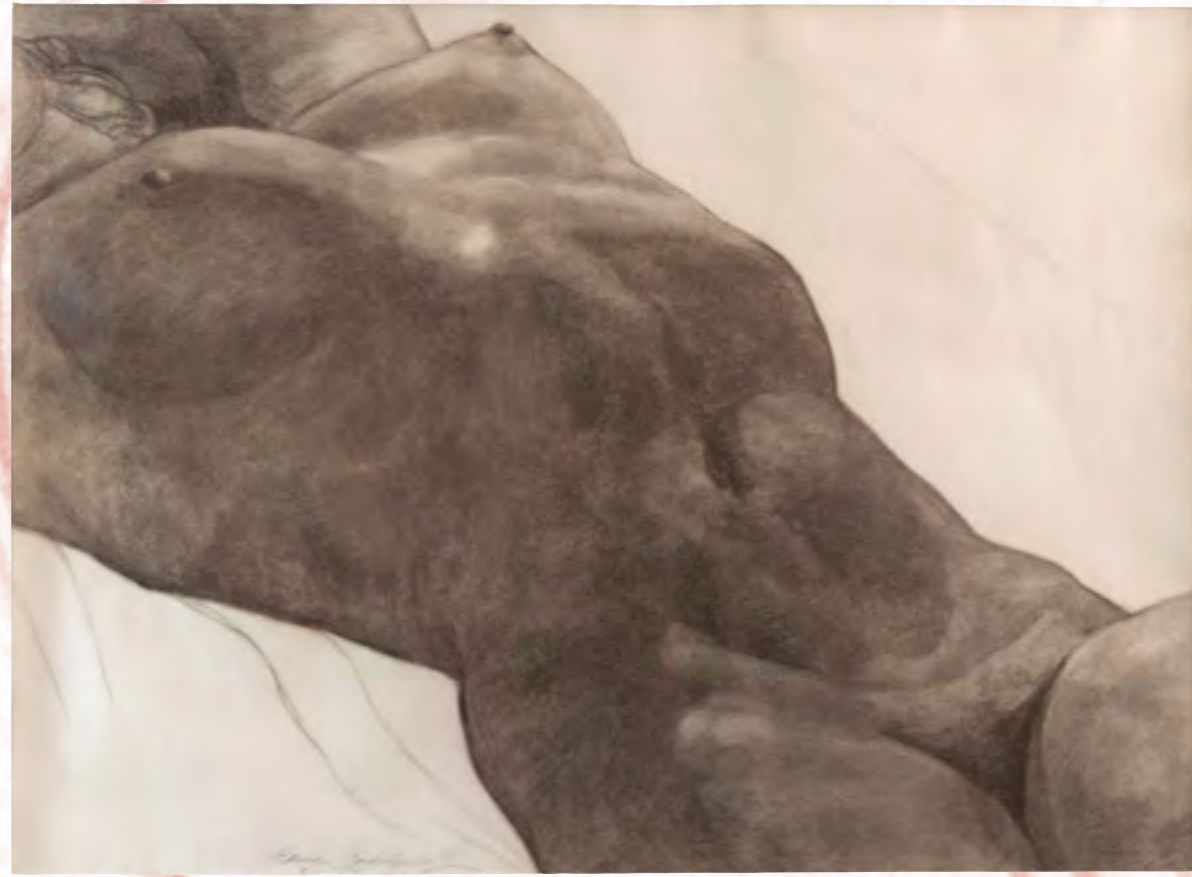
VIDA Hena Rodríguez 1938 Carboncillo sobre papel 50 x 69,5 cm

La escultora Hena Rodríguez (1915?-1997) y la multifacética artista Carolina Cárdenas (1903-1936) hicieron parte, durante los años veinte y treinta, de un valioso círculo de artistas, políticos e intelectuales de avanzada. También, como las mujeres de entreguerras, adoptaron una figura andrógina, usaron el corte à la garçonne y lucieron pantalones o vestidos cortos de talles largos.